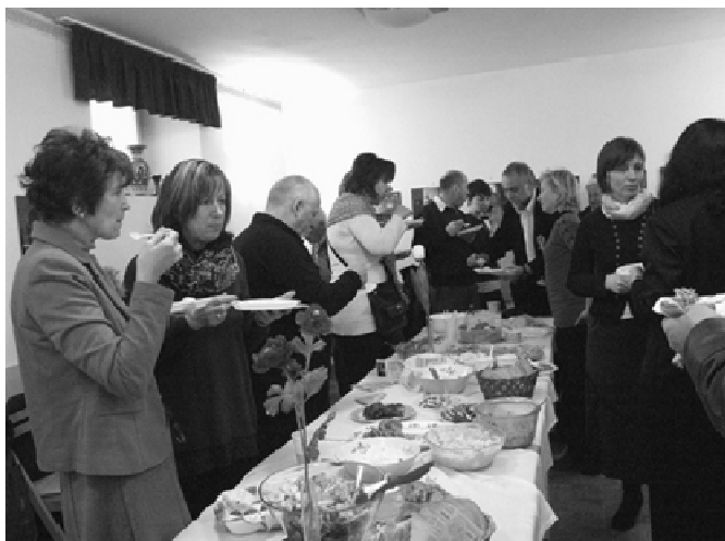
Közös ebéd batyuból.