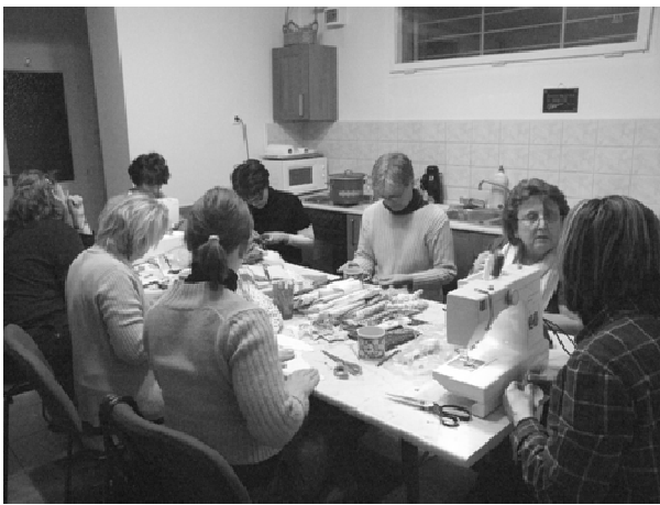
Havonta kézműves foglalkozásra kerül sor.