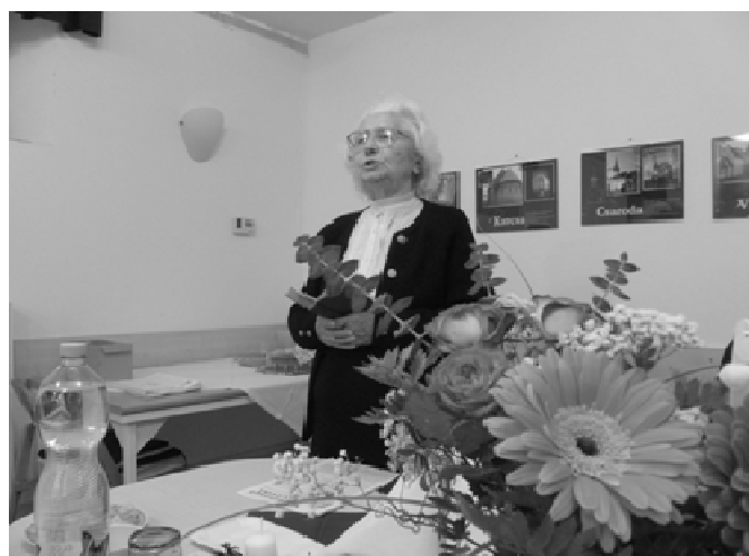
December 18-án volt idős testvéreink karácsonyi úrvacsorás istentisztelete és szeretetvendégsége.