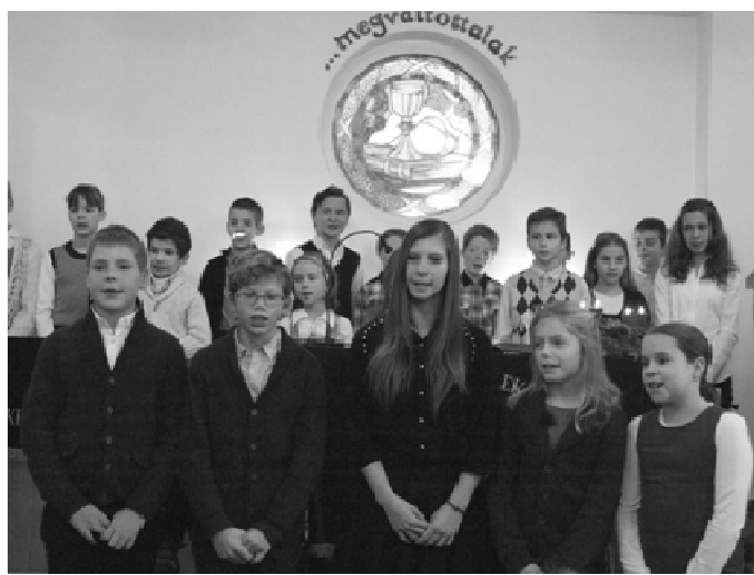
Advent negyedik vasárnapján és a december 24-ei családi istentiszteleten gyermekeink szolgáltak.