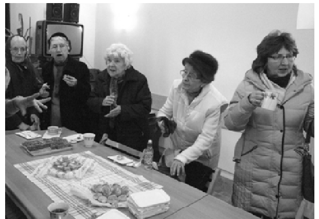
Minden hónap harmadik vasárnapján közös teázásra, beszélgetésre nyílik lehetőség az istentisztelet után gyülekezeti termünkben.