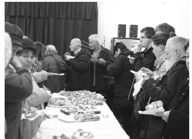
Január 20-24 között részt vettünk az ökumenikus imahét istentiszteletein. A záró alkalmat követően gyülekezeti termünkben szeretetvendégség volt.