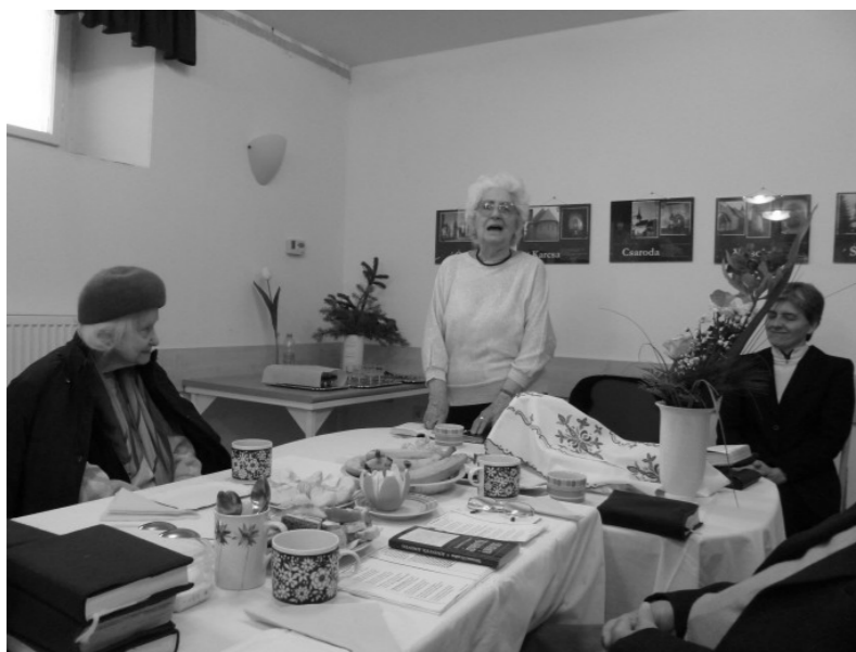
December 19-én idősök karácsonyi úrvacsorás istentisztelete és agapéja.